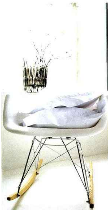
BLANC DES VOSGES

Taies d'oreillers Marquise, percale peignée, 35 € (65 x 65 cm). Blanc des Vosges. blancdesvosges.fr