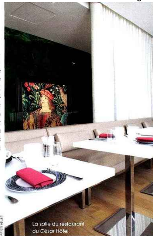
La salle du restaurant du César Hôtel.

Chambre à partir de 97 €. César Hôtel, 13, rue Sainte-Croix, 77160 Provins. Tél. 01 60 52 05 20 et lecesarhotel.com