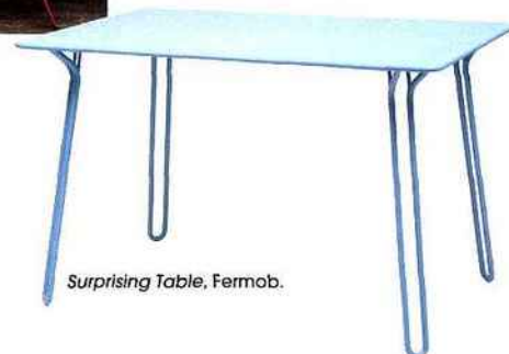
Surprising Table, Fermob.