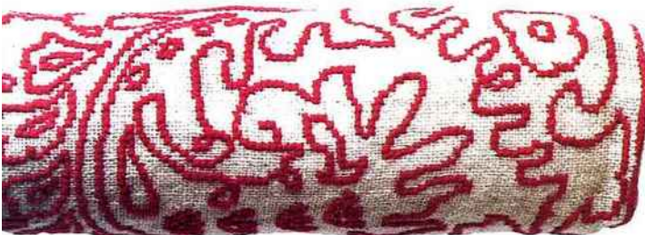
BRODÉ MAIN sur une toile de sac de café de récup' (toile de jute, laine, coton et lin), équitable et écologique, un cale-dos baptisé « Feuille d'Acanthe ». Coloris rouge, noir ou naturel. 45 x 16 cm, 32 € ou 40 x 40 cm, 48 €. Po! Paris.