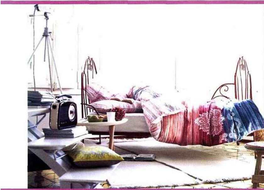
BOLLYWOOD... Parure de lit d'esprit hindou, « Exotic », tout coton, se décline en de nombreuses dimensions de housses de couette, de 79,95 à 149,95 € l'une et taies d'oreillers, 40 x 40 cm, 12,95 €, 40 x 80 cm, 17,95 €. Esprit Home.