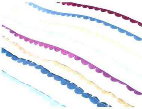
VAGUELLETES TUTTI FRUTTI, parure « Wave », mi-coton, mi-polyester. Housse de couette, 140 x 200 cm, drap-housse, 90 x 200 cm, taie, 62 x 62 cm. 109 € l'ensemble chez Madura.