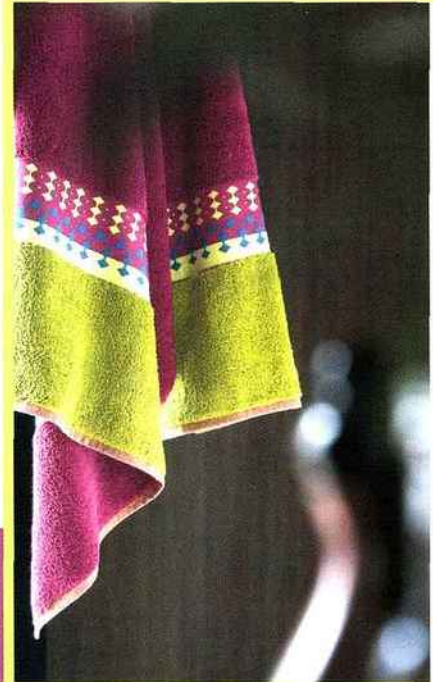
DOUCHE TONIQUE! S'enrouler dans une large et chaleureuse serviette de toilette en éponge « Venise ». 55 x 110 cm, 25 € chez Blanc des Vosges .