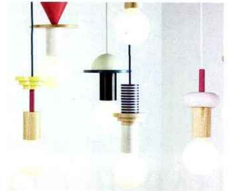
Collection de suspensions inspirées de l'esprit Memphis de la jeune marque allemande Schneid. 199 €. The Cool Republic.