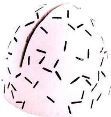
Fruit d'une collab' entre Les Petits Hauts et Hartô, ce porte-photo en bois reprend des motifs de style Memphis, adoucis par une couleur pastel. Cône photo. 19 €. Hartô.