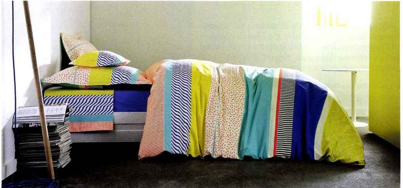
Pour 2017, le spécialiste du linge de lit mise aussi sur l'influence des années 80. Cette parure au style Memphis crée la surprise avec ses associations de couleurs pop et ses motifs géométriques. Parure L. 240 x l. 220 cm et deux taies, 179 €. Parure Saint-Malo. Blanc des Vosges.