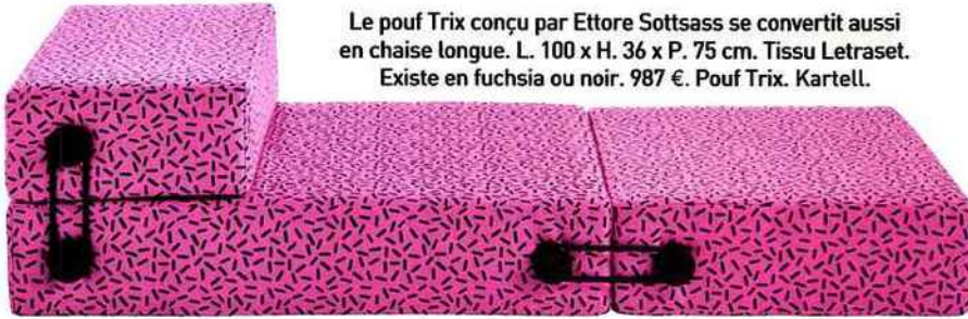
Le pouf Trix conçu par Ettore Sottsass se convertit aussi en chaise longue. L. 100 x H. 36 x P. 75 cm. Tissu Letraset. Existe en fuchsia ou noir. 987 €. Pouf Trix. Kartell.