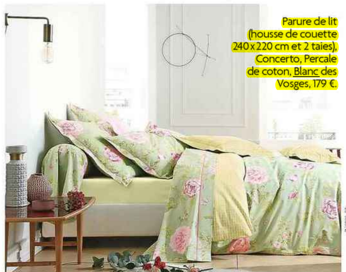
Parure de lit (housse de couette 240x220 cm et 2 taies), Concerto, Percalle de coton, Blanc des Vosges, 179 €.