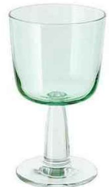
Verre à vin, Intagande, Ikéa, 2,99 €.