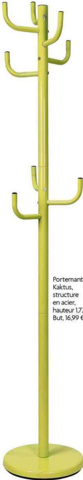
Portemanteau Kaktus, structure en acier, hauteur 1,72 m, But, 16,99 €.