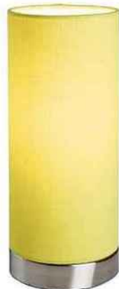
Lampe Pop, base en fer satiné et abat-jour en coton, But, 19,99 €.