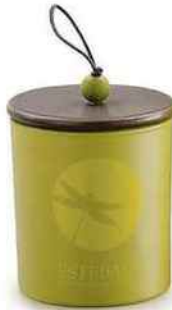
Bougie parfumée rechargeable, Sous les feuilles, Esteban, 32 €.