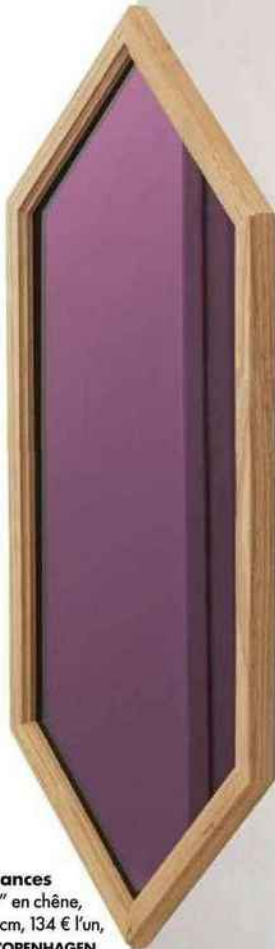
Tout en nuances Miroirs "Lust" en chêne, l. 55 x h. 80 cm, 134 € l'un, NORMANN COPENHAGEN.