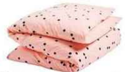
Housse de couette en coton, 220 x 240 cm. « Odette », La Cerise sur le gâteau, 149 €.