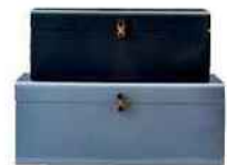
Boîtes en métal, L 52 et 60 cm. House Doctor, Living & Co, 79,95 € les deux.