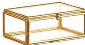
Boîte en verre et métal, L 8,5 x P 6 x H 3,5 cm. Madam Stoltz, 6 €.

RECÉRER L'AMBIANCE. La couleur s'exprime de façon intense sur les murs et le sol avec en contrepoint, sur quelques objets, une nuance plus douce. On opte pour des pièces fortes (cadre de lit, fauteuil...) et on limite les éléments décoratifs pour ne pas encombrer l'espace. (Mobilier et ambiance Ikea.)