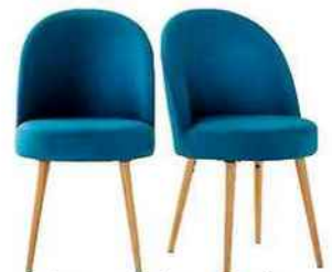
Chaises en hêtre massif et textile, L 55 x P 50 x H 86 cm. « Quilda », La Redoute, 229,75 € les deux.