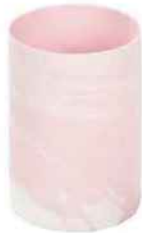
Pot en porcelaine, Ø 7 x 10,5 cm. « Tassos », Madura, 9,90 €.