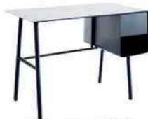
Bureau en métal, L 110 x P 54 x H 75 cm. « Steel », AM.PM, 269 €.