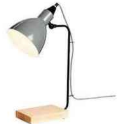
Lampe de bureau en métal et bois, H 45 cm. « Talia », Alinéa, 24,99 €.