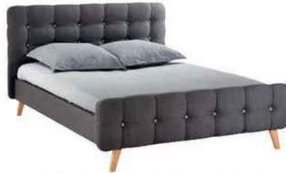
Lit revêtement tissu, pour couchage en 140 x 190 cm. « Scandi », Fly, 279,90 €.