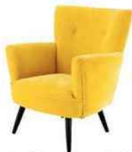
Fauteuil en velours, L 75 x P 54 x H 79 cm. « Sao Polo », Maisons du monde, 399,90 €.