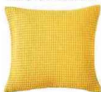
Coussin en coton, 45 x 45 cm. « Electre », Blanc des Vosges, 33 €.

P our réunir plusieurs fonctions dans une même pièce sans pour autant perdre en charme et en raffinement, apportez un soin particulier à votre déco en jouant la sobriété et en choisissant habilement votre mobilier.