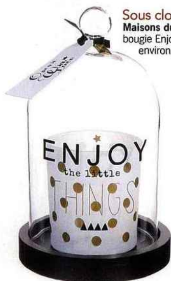
Sous cloche Maisons du Monde, bougie Enjoy, 14,99 € environ.