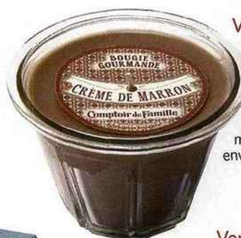
Variété gourmande Comptoir de Famille, bougie parfumée crème de marron, 16 € environ.