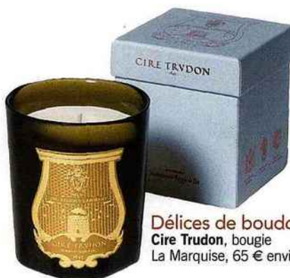
Délices de boudoir Cire Trudon, bougie La Marquise, 65 € environ.