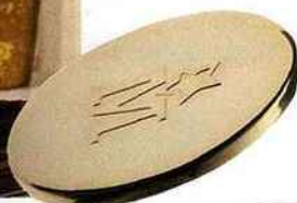
Reine des bois Bougies la Française, bougie Chouette, 29,90 € environ.