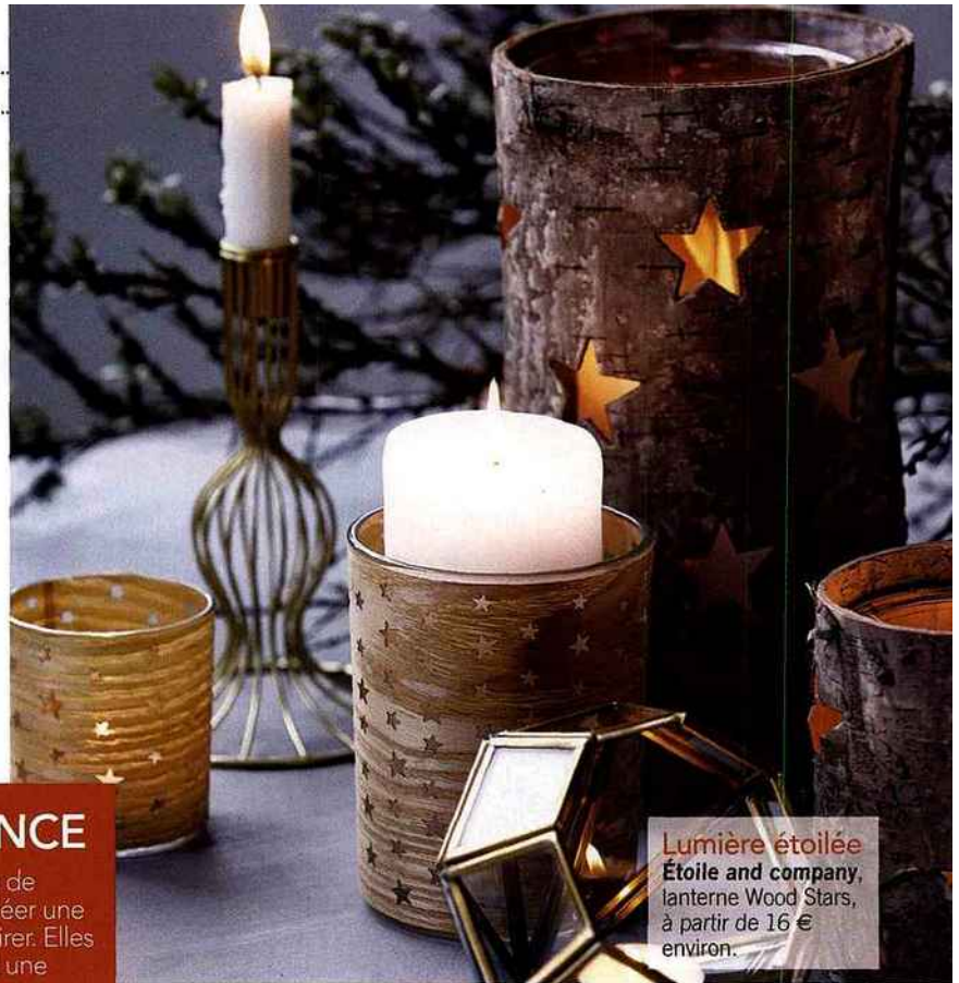
Lumière étoilée Étoile and company , lanterne Wood Stars, à partir de 16 € environ.