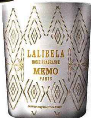
Jardin d'Eden Memo, Bougie Lalibela, 60 € environ.