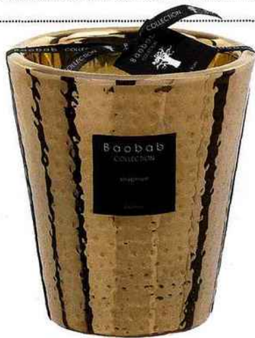
Version XXL Baobab Collection , bougie Khephren 1 kg, 119 € environ.