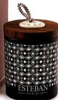
Souvenirs d'Afrique Esteban , bougie rechargeable Tek et Tonka, 32 € environ.