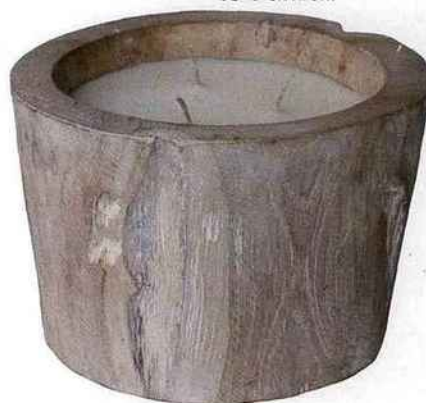
Version nature Éco chic, bougie en arbre de poivrier, 68 € environ.