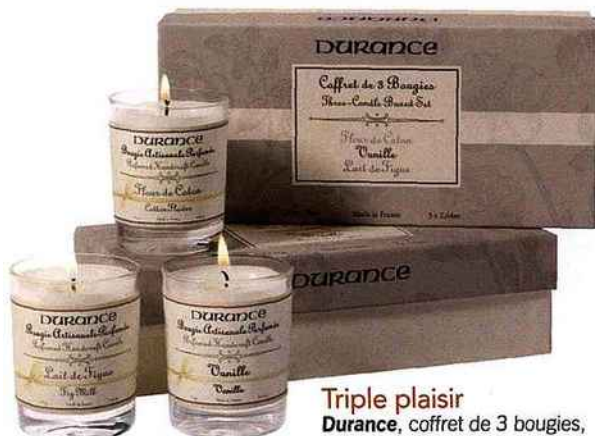
Triple plaisir Durance , coffret de 3 bougies, 24,50 € environ.