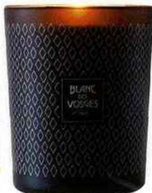
Monts boisés Blanc des Vosges, bougie parfumée Grand Large, 50 € environ.