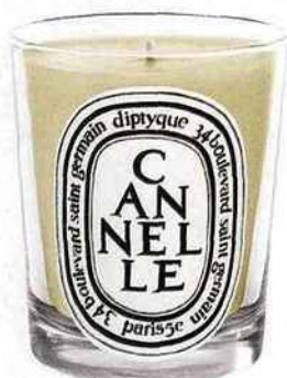
Épice hivernale Diptyque, bougie parfumée Cannelle, 44 € environ.