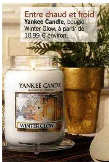
Entre chaud et froid Yankee Candle, bougie Winter Glow, à partir de 10,99 € environ.