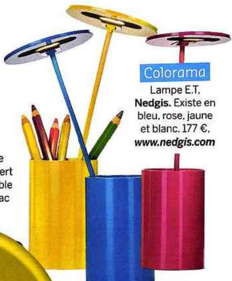
Colorama Lampe E.T, Nedgis. Existe en bleu, rose, jaune et blanc. 177 €, www.nedgis.com