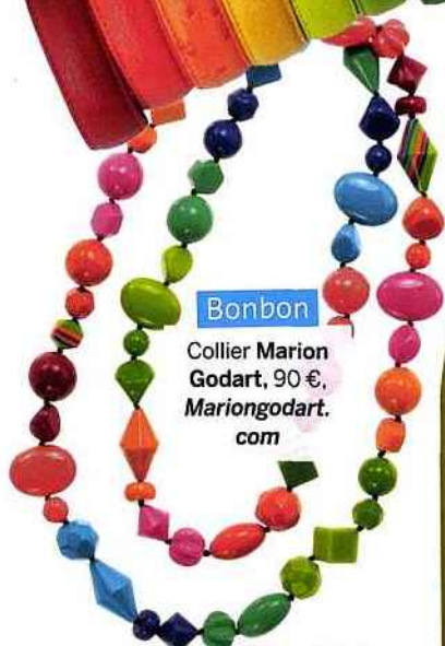
Bonbon Collier Marion Godart, 90 €, Mariogodart.com