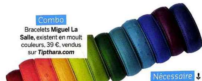
Combo Bracelets Miguel La Salle, existent en mult couleurs, 39 €, vendus sur Tiphara.com