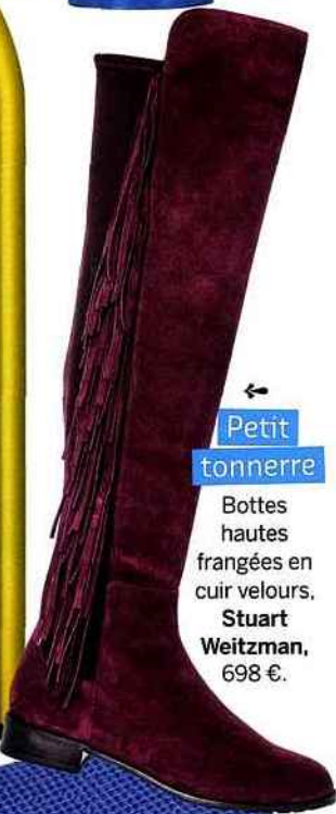
← Petit tonnerre Bottes hautes frangées en cuir velours, Stuart Weitzman, 698 €.