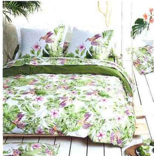
▼ Le linge de lit est ici en 100% coton, 57 fils/cm 2 et 100% «made in France», en plus de proposer une formidable invitation au voyage. Tradilinge, parure Jungle, à partir de 36,40 € environ.