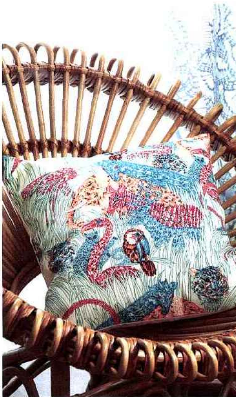
▲ Pour l'été 2015, Madura et Paul & Joe s'associent de nouveau et dévoilent une collection qui invite notamment aux voyages et à l'exotisme. Madura, Collection Paul & Joe by Madura, enveloppe de coussin Jungle, à partir de 32 € environ.