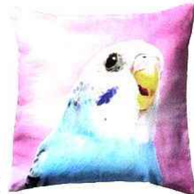
▲ Quoi de mieux pour symboliser l'exotisme qu'un perroquet aux coloris éclatants ? À installer bien douillettement sur votre lit, pour rêver d'un été plein de couleurs. H&M, taie d'oreiller perroquet, 4,95 € environ.

sit respirant, pour éviter de reproduire sous la couette le climat suffoquant des tropiques ! Le lin est particulièrement conseillé car cette étoffe est un régulateur thermique naturel, qui tient chaud en hiver et rafraîchit en été. Le lin étant assez onéreux, vous pouvez opter pour l'un de ses dérivés, le métis, un mélange de lin (dont la part doit au moins atteindre les 45% pour avoir l'appellation) et de coton. Pour un coût