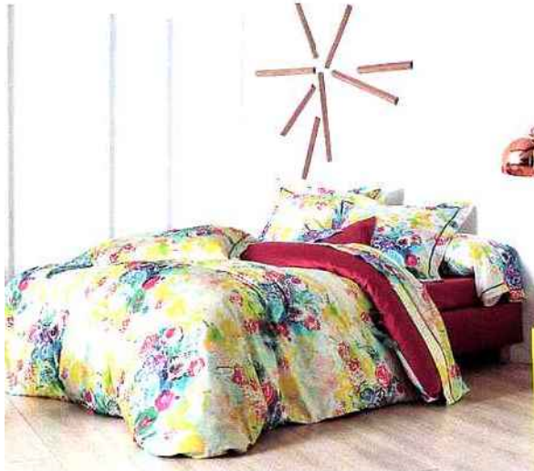
▲ Laissez-vous charmer par les motifs floraux et colorés de cet ensemble en satin de coton imprimé, Blanc des Vosges, parure Paula, 205 € environ.