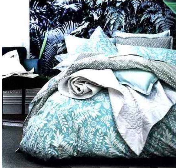
▲ Cette parure s'inspire des jungles graphiques du Douanier Rousseau et des végétaux stylisés de William Morris, pour donner l'impression de reposer au creux de lagons immenses aux eaux transparentes. Alexandre Turpault, parure Marquises, à partir de 169 € environ.