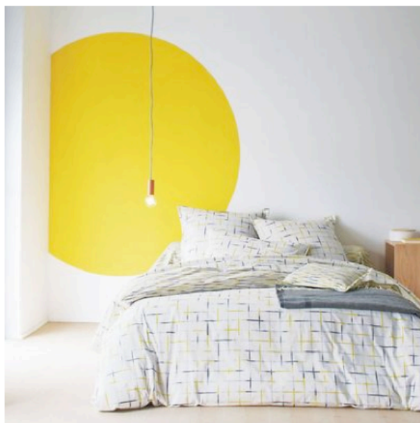
Blanc des vosges

Parure Fusion coloris fusain, 138 euros les 3 pièces en 260 x 240 cm de L., Blanc des Vosges chez cdiscout.com