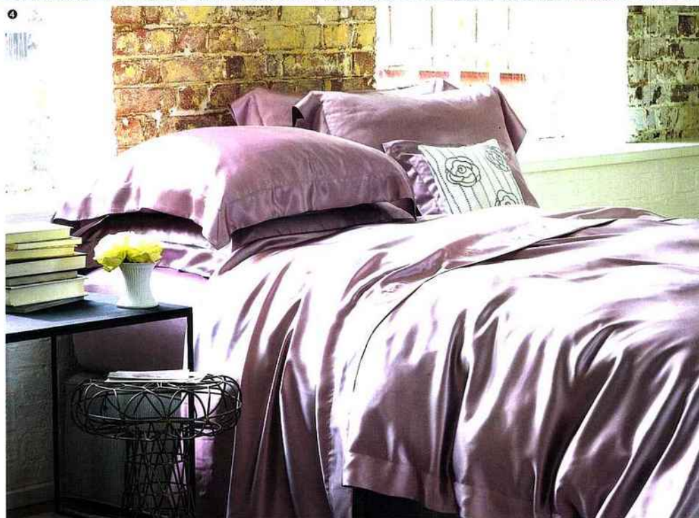
9 Parure « Paula » en satin imprimé, collection printemps-été 2015, housse de couette 240 x 220 cm et deux taies d'oreiller, 205 €, Blanc des Vosges.