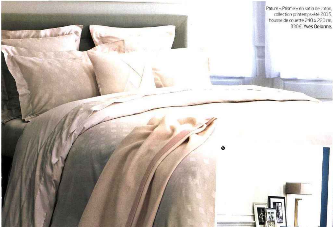
Parure « Prisme » en satin de coton, collection printemps-été 2015, housse de couette 240 x 220 cm, 330€, Yves Delorme.