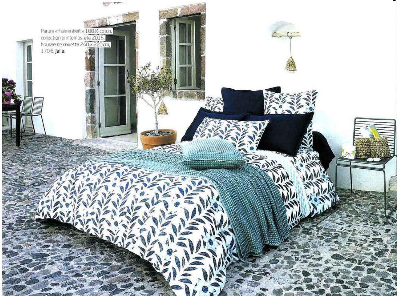
Parure « Fahrenheit » 100% coton, collection printemps-été 2015, housse de couette 240 x 220 cm, 170 €, Jalla.