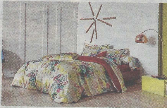
VINTAGE. A larges motifs géométriques, un ensemble bonne humeur. Housse de couette Flash, 204 x 220 cm et deux taies d'oreiller, 129 €. Rens. sur www.blancdesvosges.fr .