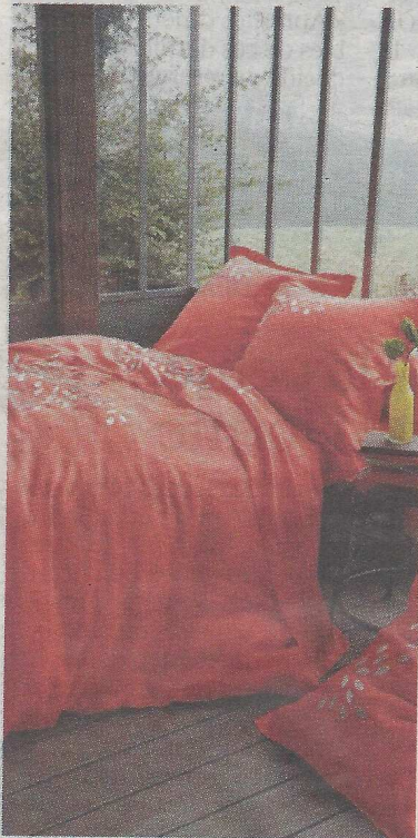
VITAMINÉ. Un ensemble de lit en lin lavé dont les broderies attrapent la lumière. Housse de couette Jeux d'ombre, 240 x 220 cm, 225 €. Liste des boutiques sur www.sylvithiriezcreations.com .