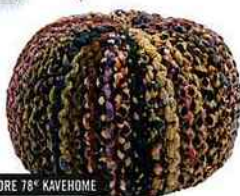
POUF XAMPA MULTICOLORE 78€ KAVEHOME