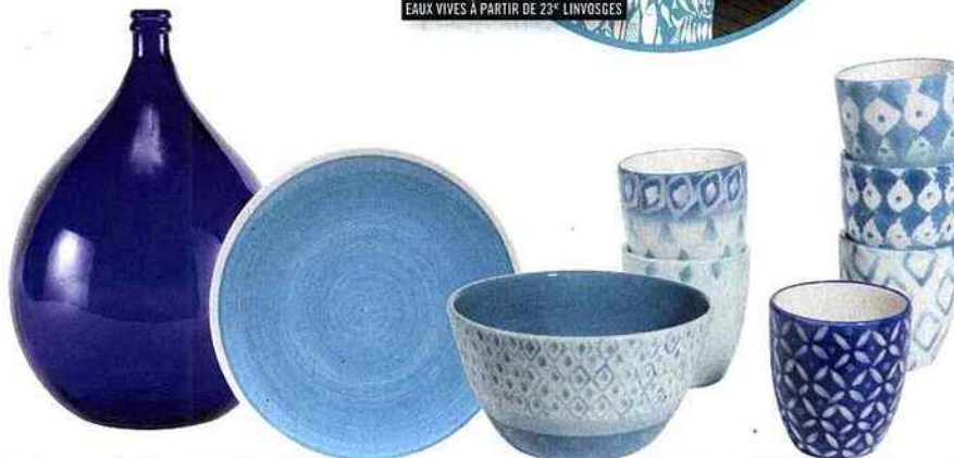
VASE VERRE BLEU HÉRAKLION 69,90€ MAISONS DU MONDE

COLLECTION LANTERNE VILLEGIATURE PARTYLITE