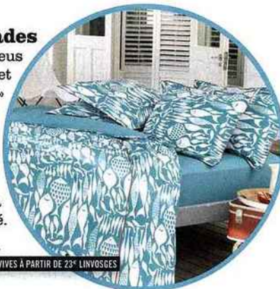
EAUX VIVES À PARTIR DE 23€ LINVOSRES

De la blancheur de la chaux aux bleus translucide, turquoise, cobalt et indigo, la maison « Cyclades » c'est la maison idyllique par excellence. De celles qui respirent l'authenticité et la douceur de vivre. Les matières sont naturelles (cotonnade, fibre tressée) et on joue de la vannerie et de la céramique artisanales à volonté.