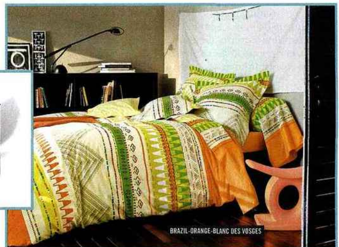
BRAZIL-ORANGE-BLANC DES VOSGES