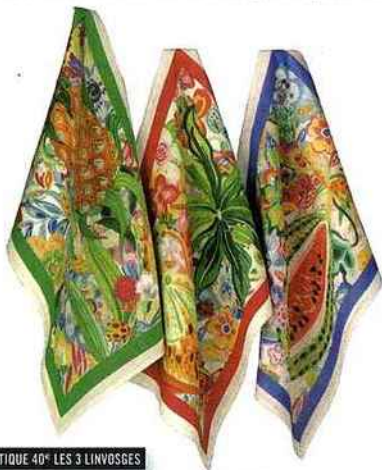
EXOTIQUE 40€ LES 3 LINVOSGES

Ici, c'est la nature qui est sublimée dans une explosion de couleurs pour une décoration synonyme de bonne humeur. Tout est en effet puisé dans ce que Dame Nature a de plus beau et de plus luxuriant à offrir (le bois, les fibres naturelles et une corbeille de fruits pour palette)... la preuve qu'il n'y a qu'à se baisser pour cueillir la déco !